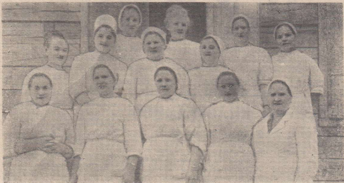
Вот они, передовые работники Дзержинской больницы!